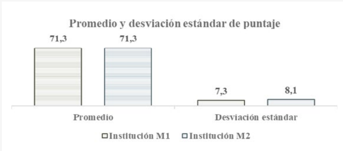
Gráfico 8 Promedio y desviación estándar de puntaje de instituciones M1 y M2.