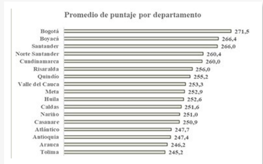
Gráfico 1 Media Colombia con resultados más destacados.

1 El artículo expone algunos apartados de los reportes de benchmarking producidos por el autor y disponibles en el sitio: https://sites.google.com/a/unal.edu.co/danielbogoya/4-benchmarking-de-colegios . Los datos empleados fueron tomados de las tablas disponibles en el sitio ftp://ftp.icfes.gov.co/