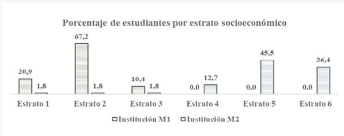
Gráfico 9 Porcentaje de estudiantes por estrato socioeconómico para instituciones M1 y M2.