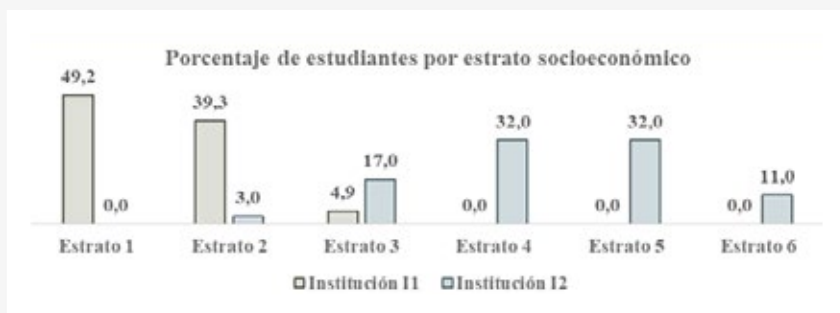
Gráfico 6 Porcentaje de estudiantes por estrato socioeconómico para instituciones I1 e I2.

Las dos instituciones mostradas comparten aproximadamente el mismo lugar privilegiado de rendimiento global, en un lugar muy alto de la escala, y las entidades territoriales a las que pertenecen están relativamente cerca en el promedio logrado: Nariño, con 251,04 puntos; y Risaralda, con 256,03 puntos (gráfico 1). En ambas instituciones la mayor fortaleza se demuestra en inglés, con 65,2 puntos de promedio para I1 y 65,4 puntos para I2, seguida de matemática, con 63,6 puntos en I1 y 63,5 puntos en I2, mientras que las debilidades relativas se observan en Ciencias Sociales y Ciudadanas para I1, con 60,9 puntos, y Ciencias Naturales para I2, con 60,8 puntos (gráfico 4). En relación con la desviación estándar (la cual representa un indicador que es inversamente proporcional a la equidad de aprendizaje), se aprecian fortalezas en lectura e inglés, para I1, con 7,4 puntos, y en lectura para I2, con 7,1 puntos, mientras que las debilidades relativas aparecen en ciencias sociales para ambos colegios y además en inglés para I2 (gráfico 5). Si bien se registran diferencias de sector y jornada, así como en el porcentaje de mujeres en los dos colegios analizados, con 11,1% más en la institución I1 (gráfico 3), la mayor asimetría se revela en la composición socioeconómica, calculada con base en el estrato reportado por los estudiantes: 88,2% de estratos uno y dos en I1, frente a 75% de estratos cuatro, cinco y seis en I2 (gráfico 6).