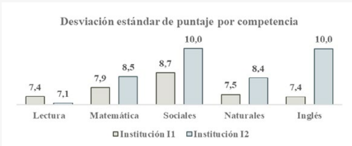
Gráfico 5. Desviación estándar de puntaje por competencia para instituciones I1 e I2.