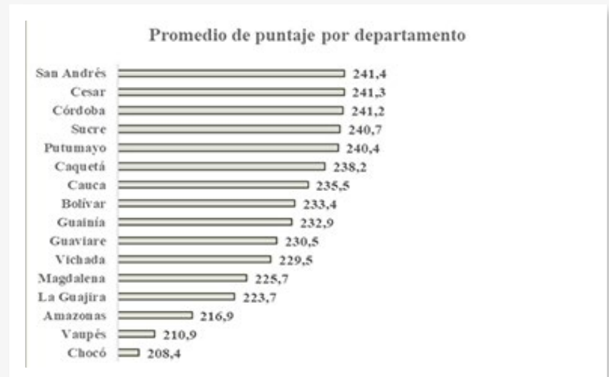
Gráfico 2 Media Colombia que reclama intervenciones más urgentes en educación básica y media.