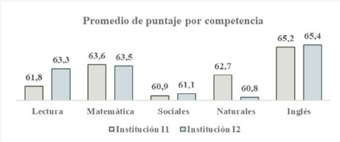
Gráfico 4 Promedio de puntaje por competencia para instituciones I1 e I2.